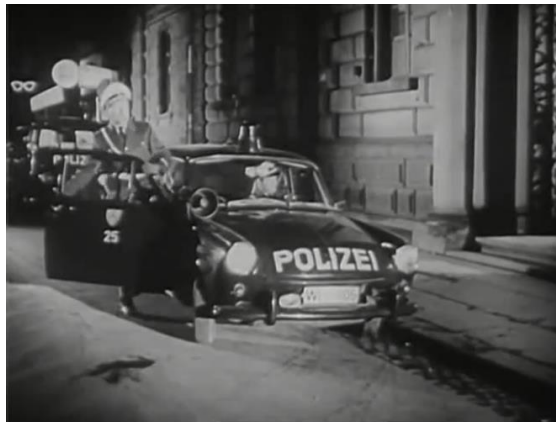
Sendung „Vorsicht Falle“ vom 16.02.1965 https://www.dailymotion.com/video/x7yl52n